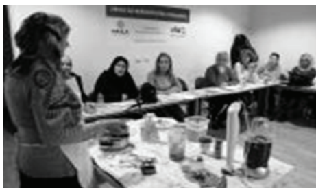
Learning to be a geriatric nurse at the AEC Nahla