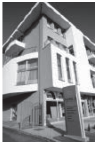
Source: VHS Cham Adult Education Centre Nahla Source: DVV International

Within the same project another document has been adopted: Strategic Platform for Development of Adult Education in the Context of Lifelong Learning in Bosnia and Herzegovina for the Period 2014-2020 . This document was adopted in October 2014. This important document is a legal framework for acting and cooperation between authorities in the field of adoption and full implementation of strategic documents related to adult education. There have been significant steps forward at the entity and cantonal levels when it comes to adoption of laws on adult education, thanks to the lobbying of different international organisations which work in B&H. The first law on adult education was adopted in 2009 in RS, and after that several cantons adopted laws: Una-Sana Canton (2013), Zenica-Doboj Canton (2014), Bosnia-Podrinje Canton Goražde (May 2015), West Herzegovina Canton (July 2015), Tuzla Canton (July 2015) and Canton Sarajevo (October 2015). Four cantons in the Federation of B&H and District Brčko still do not have laws on adult education.