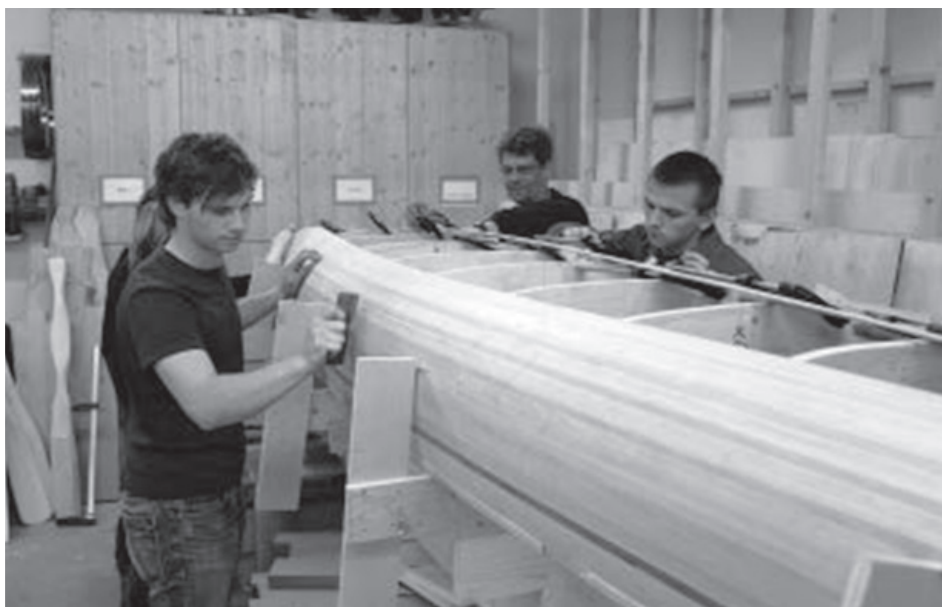
Carpentry workshop at the VHS Cham: building a canoe

The results from previous research gave us some orientation in formulating our goal. There were not many previous research projects, but they concluded that management in organisations for adult education differs from management in other organisations, small companies, etc., and that it is determined by numerous factors of different origin, which are necessary to examine in more detail.