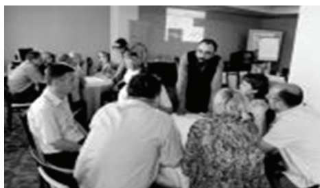
Management in adult education course by DVV International