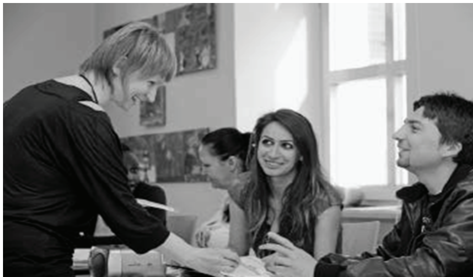
German language course in the VHS Cham