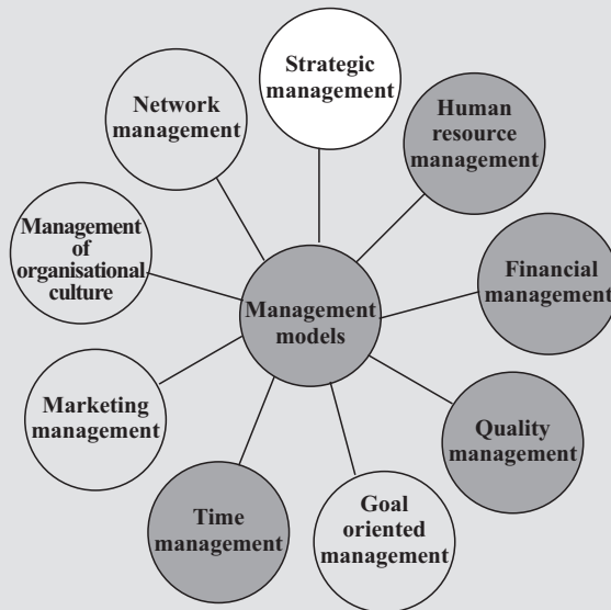
Image 1: Models recommended for implementation in organisations for adult education

such as in Bavaria, we do not find implementation of the marketing management model very important, while this model is very important in financially unstimulating environments, such as in B&H. In Bavaria, the Bavarian Adult Education Association invests 6-digit sums in marketing activities for its members – for adult education centres, the marketing support is understood as a central task of the association. It is obvious that an environment with well-organised systems, general or immediate, influences the implementation of the network management model. Thus, this model is important in organisations for adult education in Bavaria, while in organisations in B&H it is not considered as important. The same is with the management of organisational culture model. This model in Bavaria was marked as very important in managerial practice, most likely because it responds to strong competition, while in the B&H environment organisations do not think of this model as an important one, which can be explained by the fact that the competition-based market is still “immature” in B&H.